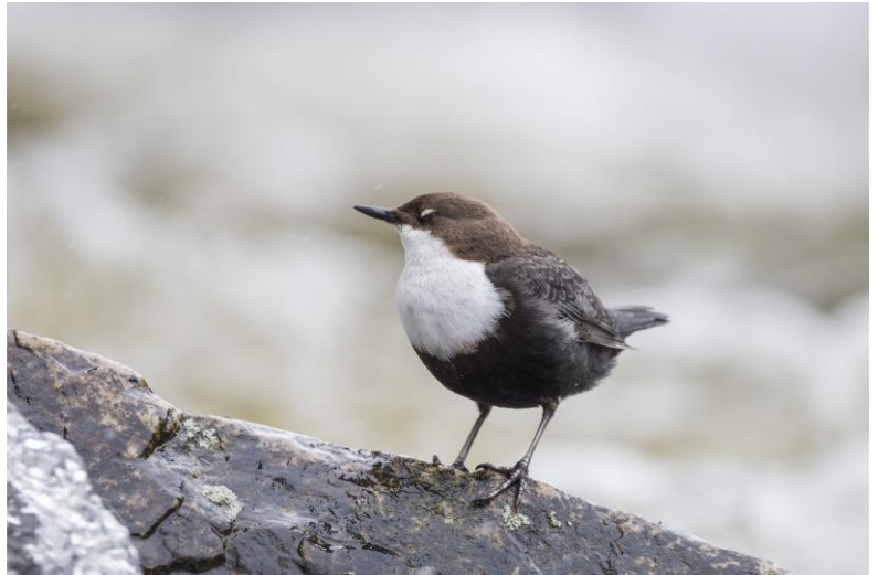
Wasseramsel