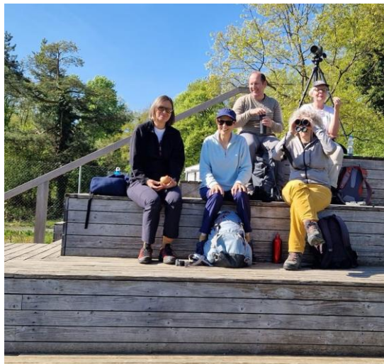
Die Exkursions-Teilnehmer genehmigen sich eine wohlverdiente Pause.