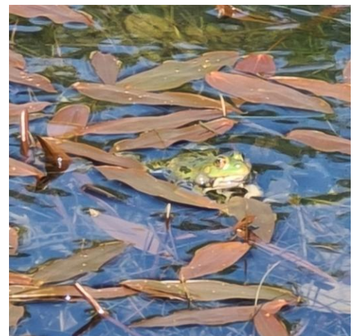
Ein Teichfrosch zeigte sich in der Teichanlage kurz vor Münchenstein.