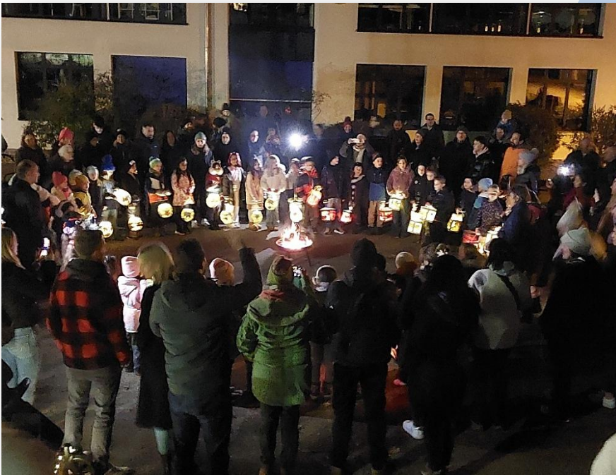
11. November 2025: Laternenumzug der Kinder des Kindergartens sowie der 1. sowie 2. Klasse