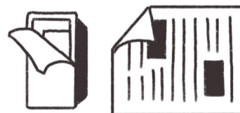
Abfälle (z.B. Kunststoffe, Verpackungen, Papier, Karton)