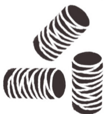
Gängige Anzündhilfen (z.B. Holzwolle)