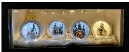
Fenster vom 2023