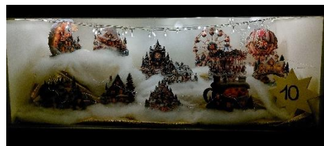
Fenster vom 2024