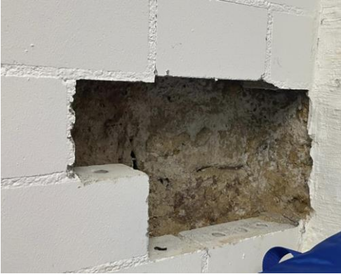
Vormauerung und alte Aussenwand

Der Gemeinderat möchte den Keller sowohl für die derzeitige Mieterin als auch für zukünftige Nutzungen als trockenen und funktionalen Raum verfügbar machen, indem eine fachgerechte Abdichtung vorgenommen wird.