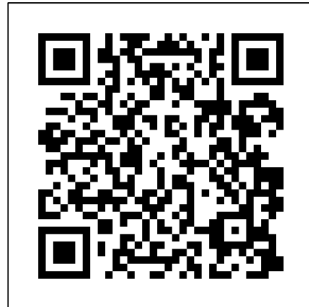
QR-Code zu der Website www.Trinkwasser.ch

Die Untersuchungsergebnisse sind für die Öffentlichkeit einsehbar. Der Schweizerische Verein des Gas- und Wasserfaches (SVGW) betreibt mit www.trinkwasser.ch eine Plattform, auf der Gemeinden ihre Trinkwasserwerte freiwillig publizieren können. Diese Plattform ist für die Wasserversorgungen zwar nicht obligatorisch, hat sich jedoch als sehr nützlich und benutzerfreundlich erwiesen.