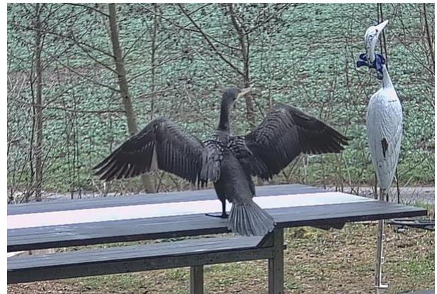
In flagranti erwischt

In der Schweiz gibt es Kormorane erst seit etwa 20 Jahren. Die Berufsfischer diverser Schweizer Seen haben Angst um die Fischbestände.