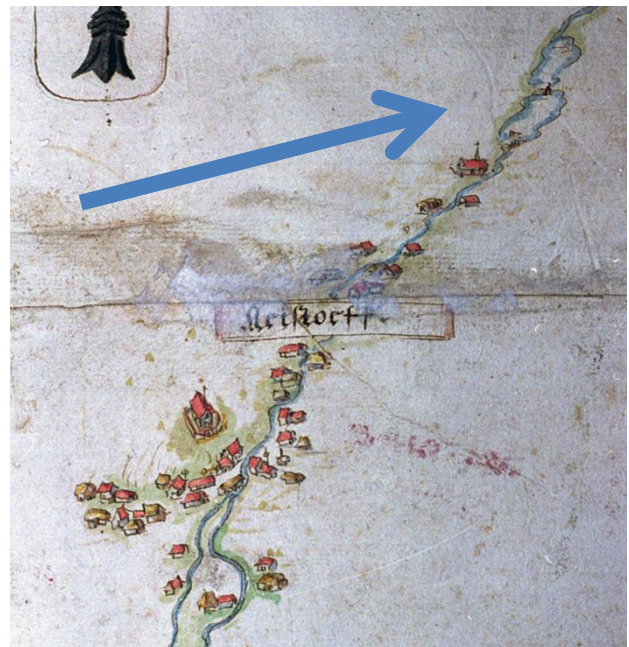
Bild von 1604

Ob ähnliches in der langen Geschichte der Fischweihern schon vorkam?