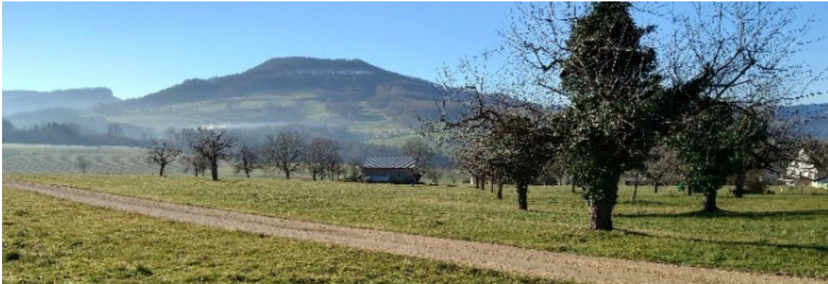
Bildlegende: Rünenberg (Blickrichtung Zigflue), 15.02.2023

Bl. Im Mai 2023 haben die Volkswirtschafts- und Gesundheitsdirektion, die Bau- und Umweltschutzdirektion zusammen mit der Natur- und Landschaftsschutzkommission zu drei regionalen Landschaftsspaziergängen eingeladen. Die Wahrnehmung und die Wertschätzung von vielfältigen und strukturreichen Landschaften stand dabei im Vordergrund. Bei weiteren Anlässen soll die Thematik und der Austausch zwischen Kanton, Gemeinden und Planungsbüros vertieft werden.