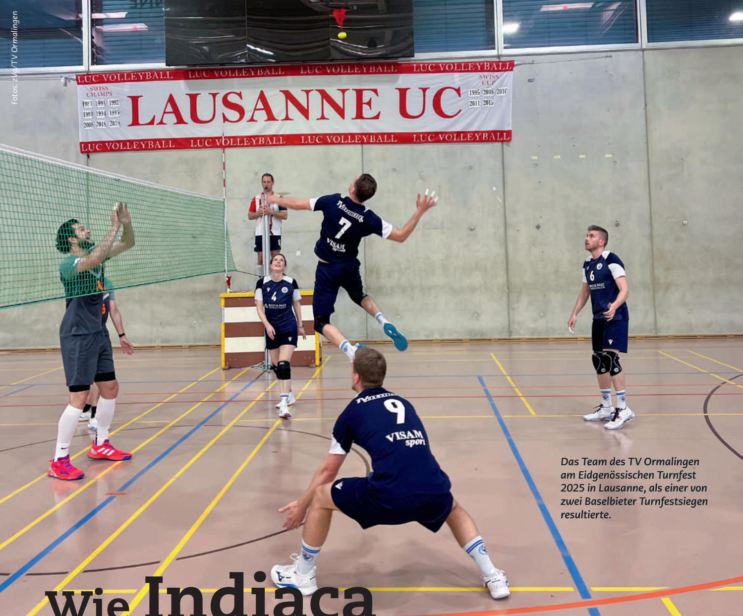
Das Team des TV Ormalingen am Eidgenössischen Turnfest 2025 in Lausanne, als einer von zwei Baselbieter Turnfestsiegen resultierte.