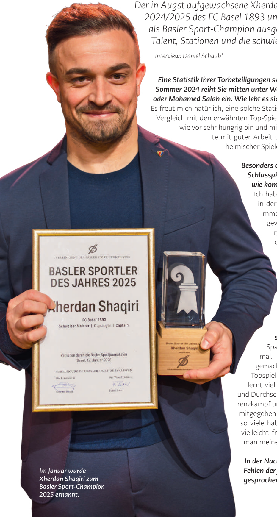
Im Januar wurde Xherdan Shaqiri zum Basler Sport-Champion 2025 ernannt.