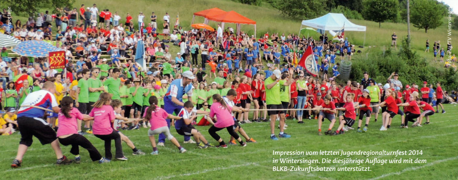
Impression vom letzten Jugendregionalturnfest 2014 in Wintersingen. Die diesjährige Auflage wird mit dem BLKB-Zukunftsbatzen unterstützt.