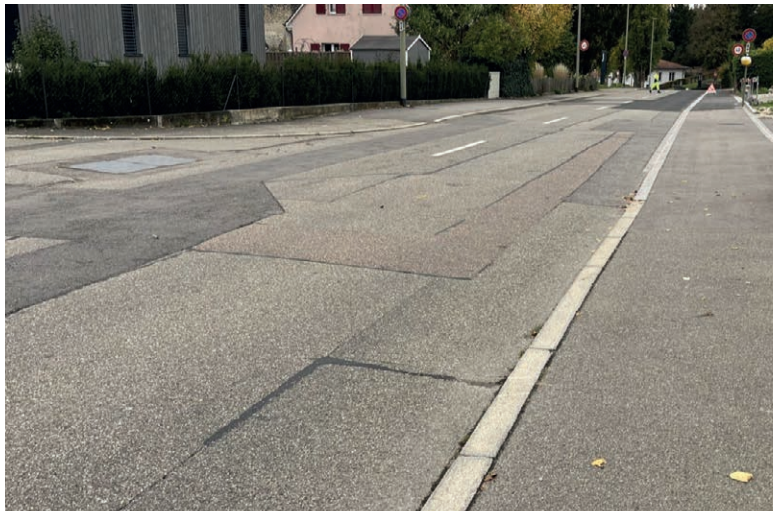
Momentaner Zustand der Giebenacherstrasse oberhalb des Römermuseums.