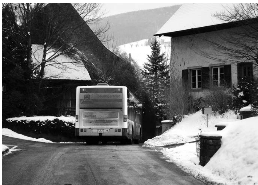
Abb. 6, 7: Arisdorf, Kantonsstrasse