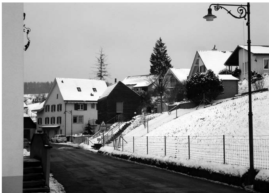
Abb.4, 5: Arisdorf, Kantonsstrasse