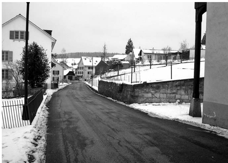
Abb. 12, 13: Arisdorf, Kantonssstrasse