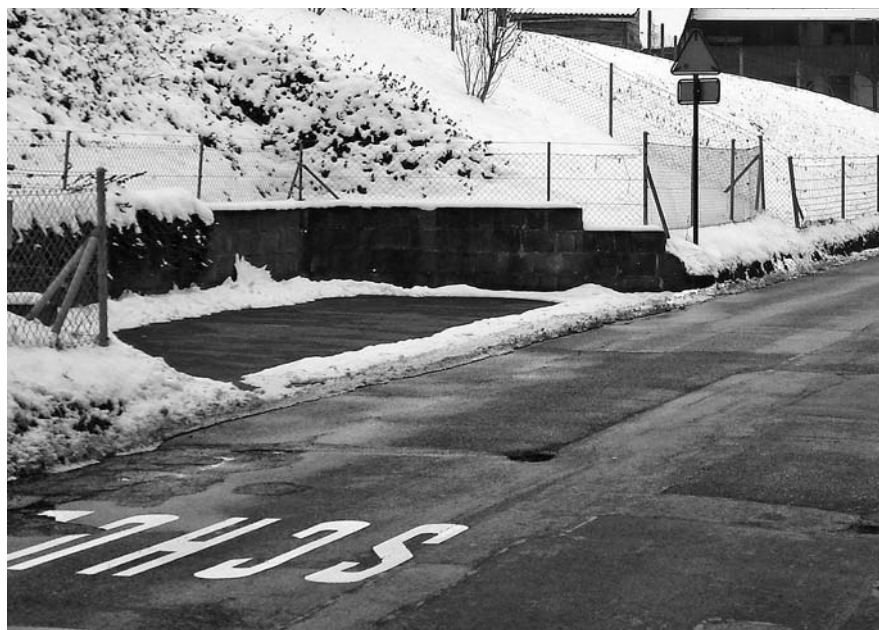
Abb. 15, 16: Arisdorf, Kantonsstrasse