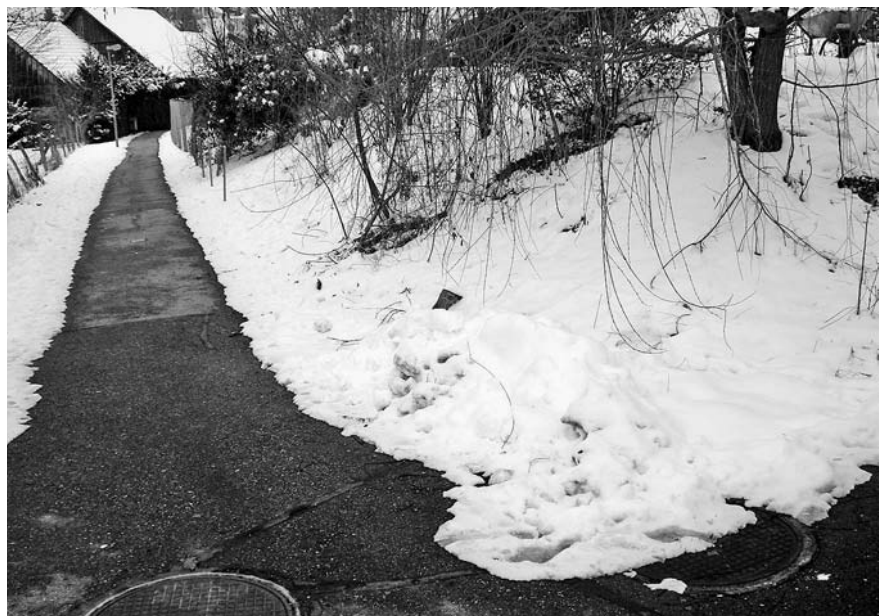
Abb. 17: Arisdorf, Fussgänger Verbindung parallel zur Kantonsstrasse