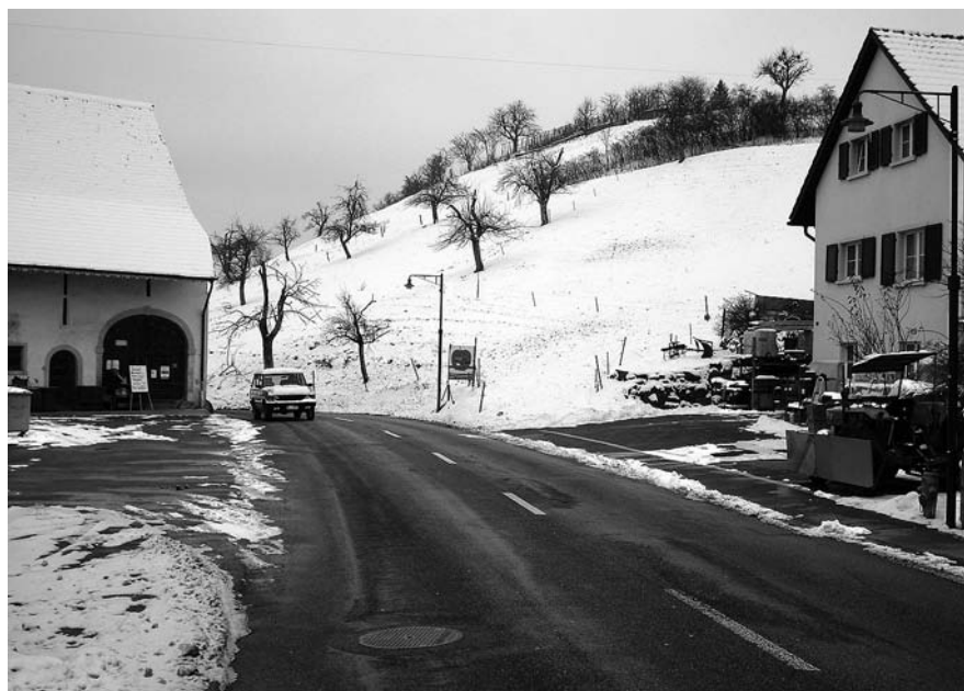
Abb.2, 3: Arisdorf, Kantonssstrasse