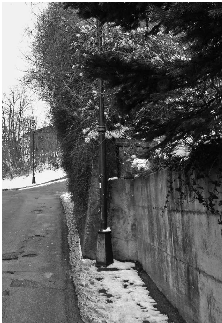
Abb. 14: Arisdorf, Kantonstrasse