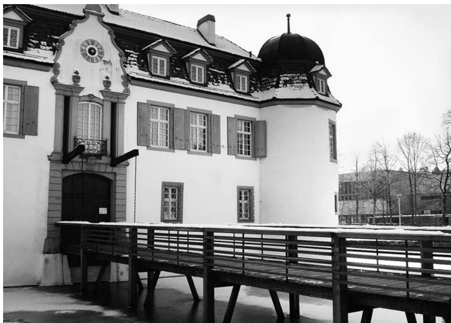
Steg auf der Südseite des Bottminger Schlosses vor 24 und nach der Renovation