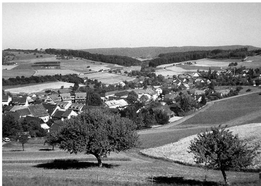
Abb. 8: Arisdorf 1941, Abb. 9: Arisdorf 1999