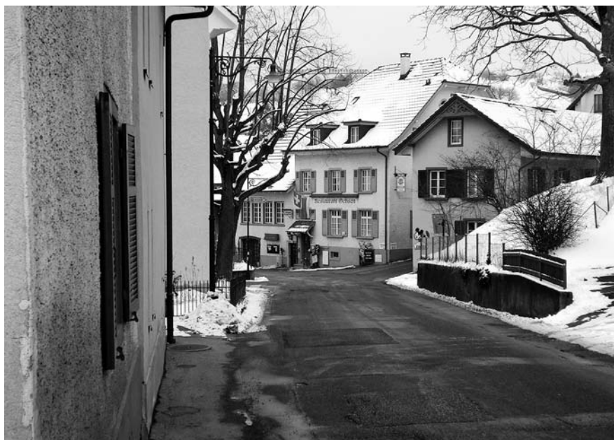
Abb. 10, 11: Arisdorf, Kantonsstrasse