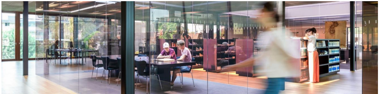
Das Staatsarchiv hat am 28. Oktober 2021 seinen digitalen Lesesaal eröffnet.

Nach knapp zwei Jahren intensiver Entwicklungsarbeit präsentierte das Staatsarchiv seinen digitalen Lesesaal der Öffentlichkeit unter der Bezeichnung «MEMORY.BL». In Zusammenarbeit mit der Schweizer Software-Firma 4teamwork ist eine Infrastruktur entstanden, die neben vielfältigen Suchoptionen eine flexible Präsentation und innovative Vermittlung von digitalen Inhalten und Bildmaterial ermöglicht. Für das ganze Staatsarchiv-Team stellte der Go-Live-Event am 28. Oktober 2021, an welchem der neue digitale Lesesaal erstmals der Öffentlichkeit präsentiert wurde, den eigentlichen Höhepunkt des Jahres dar.