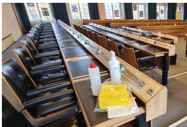
Der Landratssaal war für Sitzungen vor Ort gefragt. Eine der Schutzmassnahmen war die Desinfektion der Pulte.

Da für die Erfüllung verschiedener Aufgabenbereiche, wie die Postbewirtschaftung, die Instruktionen für Sitzungen im Regierungsgebäude oder die Beglaubigungen, eine Präsenz im Regierungsgebäude erforderlich ist, war die Mehrheit des Teams der Zentralen Dienste jeweils vor Ort tätig. Homeoffice war deshalb nur teilweise möglich.