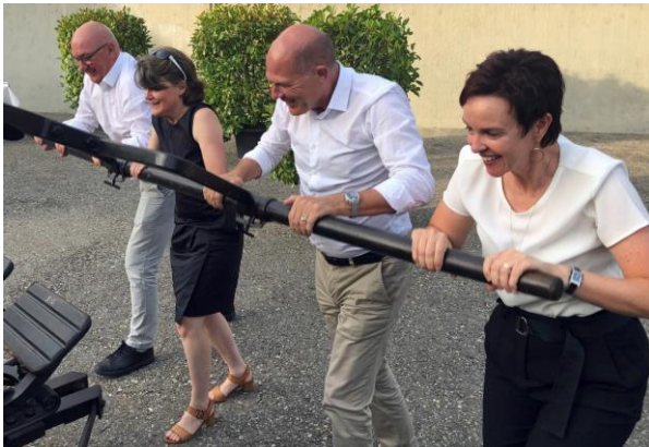
Gemeindebesuch in Hemmiken

Trotz Corona konnten im Frühjahr und Sommer verschiedene Anlässe des Regierungsrats durchgeführt werden.