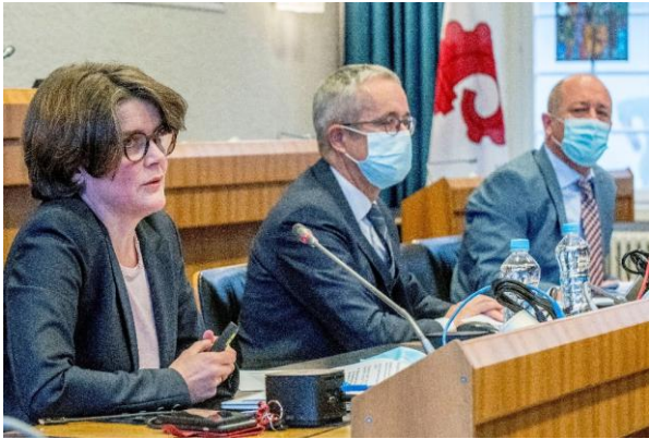
Reaktivierung Krisenstab Kanton Basel-Landschaft