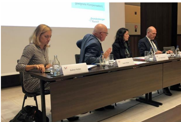
Medienkonferenz externer Bericht Neubau Biozentrum