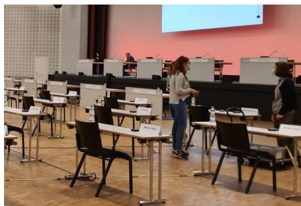
Die Landratssitzungen fanden 2021 auch in der Messe Basel statt. Hier waren Vorbereitungsarbeiten ebenfalls notwendig.

Im Jahr 2021 absolvierten folgende KV-Lernende einen Teil ihrer dreijährigen Ausbildung bei der Landeskanzlei: