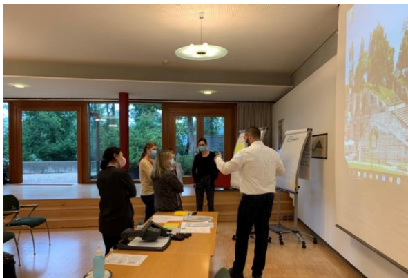
Der Workshop der Landeskantone fand in den Räumlichkeiten des Landsitzes Castelen statt.

Für die Landschreiberin, das Leitungsteam und die Mitarbeitenden war der Workshop am 15. September 2021 in Augst ein wichtiger und erfolgreicher Anlass, der das Team der Landeskantone insgesamt gestärkt hat. Es wurde engagiert diskutiert und konstruktive Optimierungsansätze wurden erarbeitet. Für die Überarbeitung der Prozessabläufe und deren zeitgemässe Darstellung wurde ein Projekt lanciert. Die weiteren Inputs werden in den kommenden Abteilungsleitungssitzungen aufgegriffen.