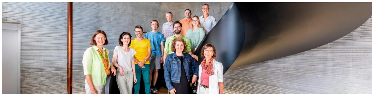
Das Team des Staatsarchivs freut sich über das neue Angebot für die Öffentlichkeit.