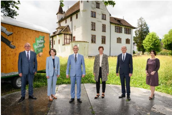
Offizielles Regierungsfoto 2021/22

Im Berichtsjahr hat der Regierungsrat an 38 ordentlichen Sitzungen (2020: 40) und 3 Klausuren insgesamt 1'867 Geschäfte (2020: 1'829) behandelt, 300 Landratsvorlagen (2020: 262) überwiesen und über 255 Beschwerden entschieden (2020: 268). Seit Beginn der Pandemie haben zudem eine ausserordentliche Sitzung und fünf Videokonferenzen stattgefunden. Von den 1'867 beschlossenen Regierungsgeschäften betrafen 176 Beschlüsse die Covid-19-Pandemie. Ausserhalb der regulären Sitzungen wurden 50 Zirkulationsbeschlüsse gefasst.