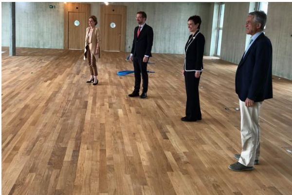
Medienkonferenz zum Univertrag

2021 wurden 261 Medienmitteilungen des Regierungsrats (2020: 231) verschickt.