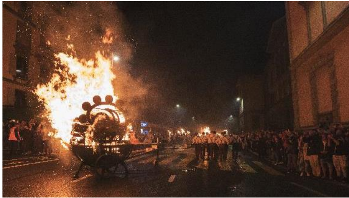
Der Baselbieter «Chienbäse»-Umzug begeisterte an der Fête des Vignerons 2019 in Vevey Tausende von Zuschauerinnen und Zuschauern.