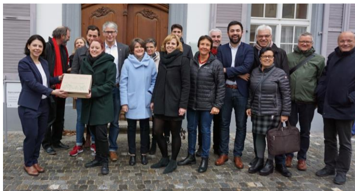
Petition für den Schutz des Hardwaldes am 17. Januar 2019.

2019 hat die Landeskanzlei insgesamt 9 Petitionen entgegengenommen.