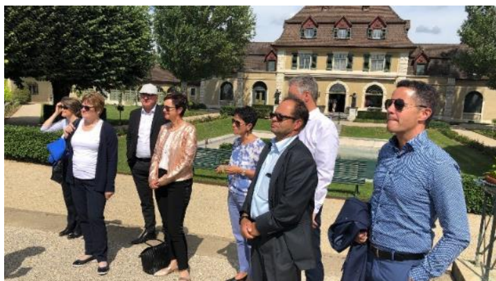
Besuch des Regierungsrats des Kantons Obwalden am 13. August 2019 im Kanton Basel-Landschaft.