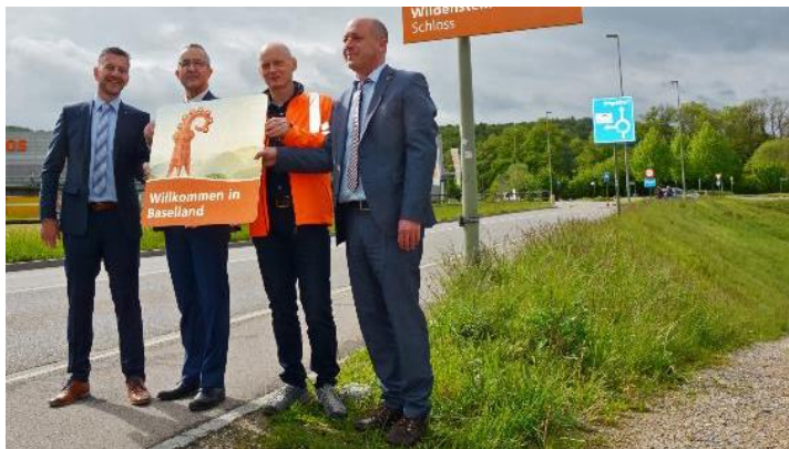
Am 9. Mai 2019 enthüllte Regierungsrat Thomas Weber feierlich das erste Schild im neuen Design.

Die «Willkommen / Auf Wiedersehen-Tafeln» von 1983 an den Strassen ins und aus dem Baselbiet wurden 2019 grösstenteils ersetzt. Mit einer neu gestalteten, touristisch ausgerichteten Signalisation setzte der Kanton Basel-Landschaft auf den National- und Kantonsstrassen eine Weisung des Bundesamts für Strassen (ASTRA) um. Die bisherigen «Kirschbaum-Schilder» konnten beim Verwertungsdienst des Kantons erworben werden – innerhalb einer Stunde waren die Schilder ausverkauft.