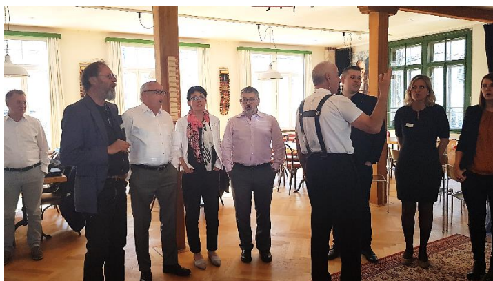
Mitglieder der Geschäftsleitung des Landrats versuchen sich nach dem Besuch einer Sitzung des Kantonsrats Appenzell-Ausserrhoden und der Besichtigung einer Hackbrett-Manufaktur im gemeinsamen Jodeln (Herisau, 1.4.2019).

Auch die Empfänge der erweiterten Ratsleitung des Landrats von Uri (am 14. November 2019, mit Besuchsprogramm) und des Ratsbüros des Grossen Rats Basel-Stadt (am 28. November 2019, mit anschliessendem Kulturprogramm) oder die Besuche der Geschäftsleitung beim Kantonsrat von Appenzell-Ausserrhoden (am 1. April 2019) sowie beim Grossen Rat von Basel-Stadt (8. Mai 2019, zusammen mit dem Büro des jurassischen Parlaments) wurden vom Parlamentsdienst organisiert bzw. begleitet.