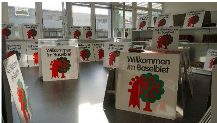
Am 8. August 2019 wurden die bisherigen «Kirschbaum-Schilder» durch den Verwertungsdienst der Sicherheitsdirektion innerhalb einer Stunde verkauft.