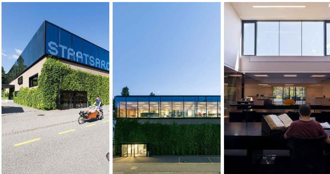
Staatsarchiv: Aussenansicht und Lesesaal

Die insgesamt 1782 (2018: 1848) Aktenrückrufe und Recherchen für die Verwaltung haben sich auf hohem Niveau stabilisiert. Die Statistik der Lesesaalbenützung durch Forschende 552 (2018: 442) ergibt längst nicht mehr ein vollständiges Bild der Archivnutzung. Durch den Ausbau des Online-Angebots über das Internet haben die schriftlichen Anfragen stark zugenommen. Forscherinnen und Forscher, die über längere Zeit ins Archiv kommen, um Quellen zu studieren, werden seltener. Die «Laufkundschaft» bleibt jedoch konstant hoch: 2071 (2018: 1'824) Personen haben sich beim Empfang des Lesesaals angemeldet mit unterschiedlichen Bedürfnissen und Fragestellungen. 1005 (2018: 866) Aufträge wurden für Private erfüllt. Aufträge für Private sind in der Regel kostenpflichtig. Die Gebühreneinnahmen betragen 60'000 Franken (2018: 59'000). Beliebt bleiben auch die persönlichen Beratungen, da viele neuen Benutzerinnen und Benutzer mit der Archivrecherche nicht vertraut sind. Erfreulich ist die Nachfrage von Schülerinnen und Schülern, die das Archiv für ihre Abschlussarbeiten nutzen.