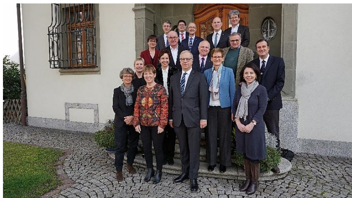
Besuch beim Swiss THP (Swiss Tropical and Public Health Institute) am 12. Februar 2019 in Basel.