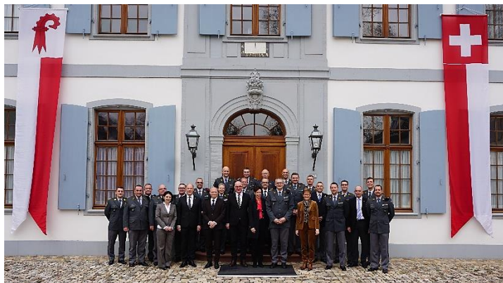
Empfang hoher Offiziere am 22. Januar 2019 im Schloss Ebenrain, Sissach.

Das Sekretariat Regierungsrat hat im Berichtsjahr verschiedene Anlässe und Besuche für den Regierungsrat organisiert. Im Folgenden eine Auswahl: