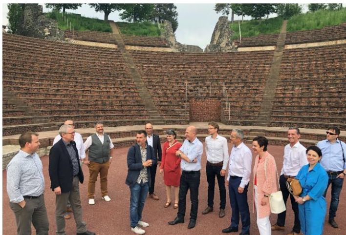
Besuch des Regierungsrats Uri am 11. Mai 2022 im Kanton Basel-Landschaft u.a. im römischen Theater in Augusta Raurica.