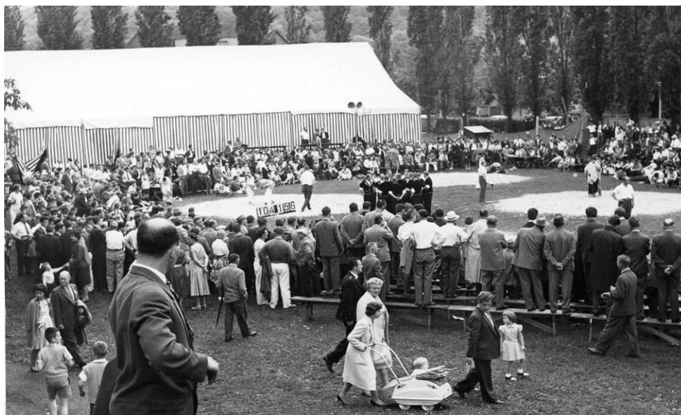
Am kantonalen Schwingertag in Muttens von 1960 galten andere Dimensionen als beim ESAF (Staatsarchiv BL, PA 6261, 10/III).

Ein Jahr nach Inbetriebnahme haben sich die Nutzungszahlen positiv entwickelt. Zur Bekanntheit von MEMORY.BL tragen nachweislich auch die regelmässig publizierten Blog- und Vitrienenbeiträge zu aktuellen regionalen Anlässen und historischen Ereignissen bei. Insgesamt wurden im Berichtsjahr 28 Blogbeiträge sowie zwei Vitrienenbeiträge publiziert. Inhaltlich basiert ein Grossteil der Beiträge auf Archivgut des Staatsarchivs BL. Sie bieten thematische Einführungen und sind mit Fotografien aus den Beständen des Staatsarchivs illustriert. Insbesondere die Blogbeiträge zu regionalen Ereignissen wie dem Eidgenössischen Schwing- und Äplerfest, dem Kantonsgeburtstag oder dem ersten Baselbieter Bundesrat, Emil Frey, stießen auf reges Interesse. Seit Ende Mai 2022 wird zweimal pro Jahr ein Newsletter an Interessierte verschickt. Dieser informiert über neue Daten auf MEMORY.BL sowie über Blog- und Vitrienenbeiträge. Von Anfang an wurden die Nutzungszahlen der neuen Plattform sowie ihrer verschiedenen Gefässe beobachtet und regelmässig ausgewertet. Nach einem Jahr im Betrieb ist eine klare Zunahme der Nutzungszahlen zu erkennen. Die drei meistbesuchten Kategorien sind Familienforschung, Archivkatalog und Fotografie – dicht gefolgt von Bestellen, Karten und Pläne sowie Blog.