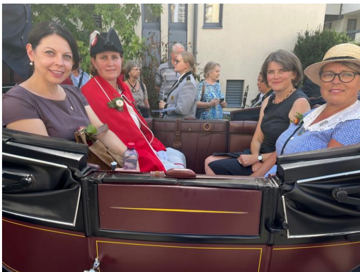
Die Präsidentinnen von Landrat und Regierungsrat zusammen mit der Landschreiberin und der Staatsweiblin am ESAF-Festumzug.

Vom 26. bis 28. August 2022 fand das Eidgenössische Schwing- und Älplerfest (ESAF) Pratteln im Baselbiet statt. Die Landeskantlei konzipierte und organisierte die Empfänge der VIP-Gäste des Regierungsrats im «Baselbieter Sporthuus» sowie die Verlosung von 1000 Eintrittsrechten für die Baselbieter Bevölkerung. Mit einem koordinierten Auftritt des Kantons, wozu auch die Auftritte der Baselbieter Tourismus-Organisation und der Polizei Basel-Landschaft gehörten, konnte das ESAF genutzt werden, um das Baselbiet kommunikativ auf der Schweizer Landkarte zu verankern.