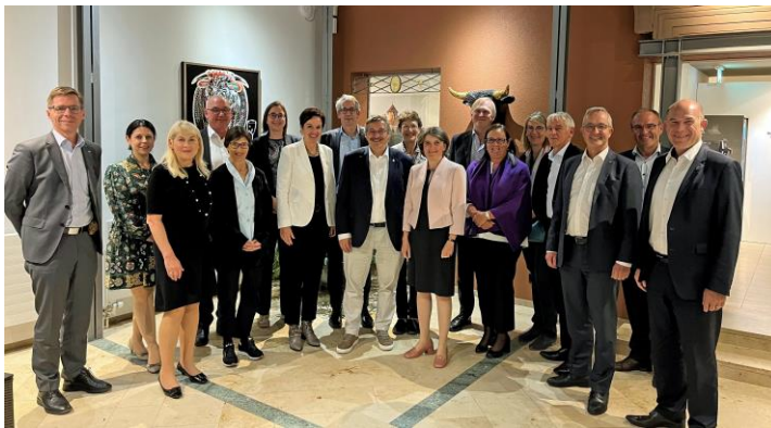
Treffen des Regierungsrats mit dem ETH-Rat am 21. September 2022.