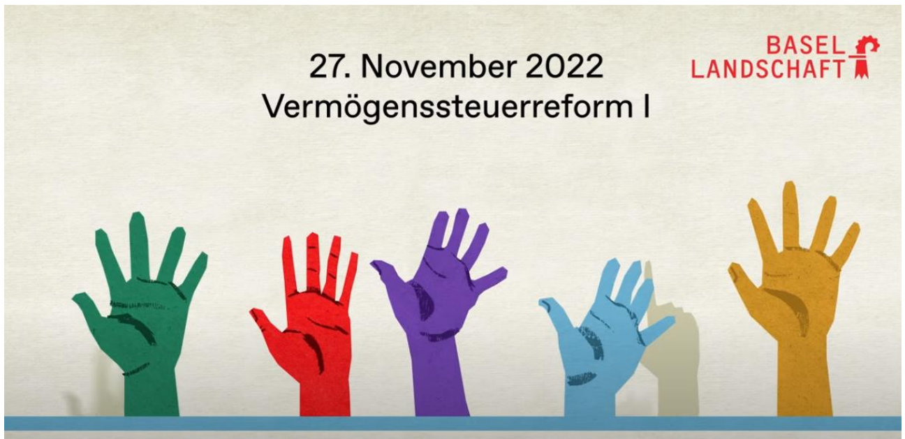
Standbild des Erklärvideos zur Abstimmung über die Vermögenssteuerreform vom 27. November 2023

Für die Abstimmung am 27. November 2022 setzte der Kanton Basel-Landschaft erstmals ein Erklärvideo ein. Diese werden neu jeweils zusätzlich zum Abstimmungsbüchlein produziert und sollen helfen, die Abstimmungsvorlagen möglichst breit zu vermitteln. Die Publikation erfolgt auf der Internetseite und auf den Social-Media-Kanälen des Kantons. Zudem sind die Videos mit einem QR-Code auf dem Abstimmungsbüchlein einfach aufrufbar. Das erste Erklärvideo wurde insgesamt 3'958-mal aufgerufen und fand eine Zustimmung «Mag ich» von 85,7 Prozent. Der Kanton Basel-Landschaft setzt mit dem ersten Video ein Zeichen in Richtung Digitalisierung und Fortschritt, nach dem Vorbild des Bundes. Damit ermöglicht der Kanton seiner stimmberechtigten Bevölkerung einen neuen Weg, sich über politische Vorlagen zu informieren und an Abstimmungen teilzunehmen. Die Videos sind abgelegt unter: www.bl.ch/abstimmungsvideos