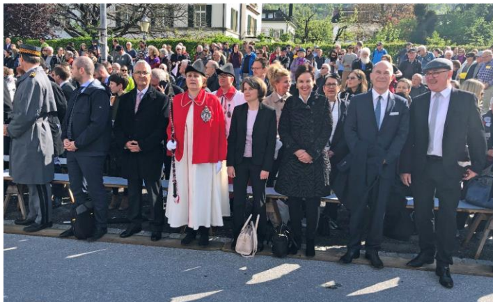
Am 1. Mai 2022 besuchte der Regierungsrat die Landgemeinde des Kantons Glarus.

Im Berichtsjahr hat der Regierungsrat an 39 ordentlichen Sitzungen (2021: 38) und 6 Klausuren insgesamt 1'977 Geschäfte (2021: 1'867) behandelt, 321 Landratsvorlagen (2021: 300) überwiesen und über 287 Beschwerden entschieden (2021: 255). Ausserhalb der regulären Sitzungen wurden 26 Zirkulationsbeschlüsse (2021: 50) gefasst.