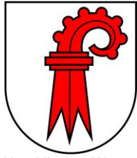
Heraldisches Wappen des Kantons Basel-Landschaft