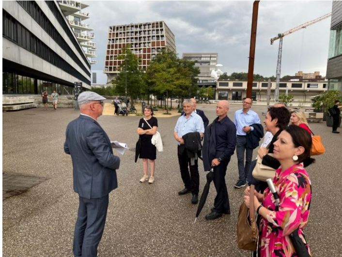
Besuch des Regierungsrats Schaffhausen am 6. September 2022 im Kanton Basel-Landschaft u.a. im Dreispitzareal in Münchenstein.