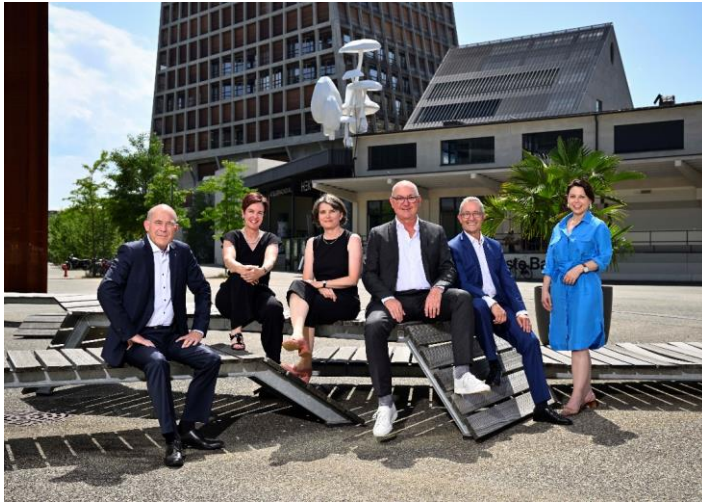
Offizielles Regierungsfoto 2022/23.

Im Berichtsjahr hat der Regierungsrat an 39 ordentlichen Sitzungen (2021: 38) und 6 Klausuren insgesamt 1'977 Geschäfte (2021: 1'867) behandelt, 321 Landratsvorlagen (2021: 300) überwiesen und über 287 Beschwerden entschieden (2021: 255). Ausserhalb der regulären Sitzungen wurden 26 Zirkulationsbeschlüsse (2021: 50) gefasst.