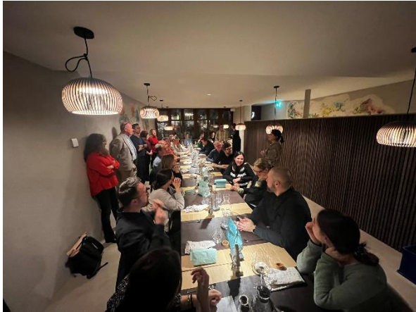
Gemütliches Beisammensein und feines Essen in der neu restaurierten Schützenstube, Liestal.