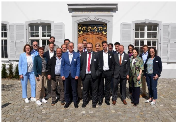
Die Geschäftsleitung des Landrats mit dem Büro des Nidwaldner Landrats am 10. April 2025 in Liestal.

2025 wurden die Leitungsorgane von gleich fünf anderen Kantonsparlamenten zu Besuchen ins Baselbiet eingeladen: Zu Gast waren das Landratsbüro Nidwalden (am 10. April 2025, mit Besuch der Landwirtschaftsgenossenschaft Agrico in Therwil und des Schweizerischen Tropen- und Public-Health-Instituts in Allschwil), das Grossratsbüro Aargau (am 8. Mai 2025, mit Besuchen der Ronda AG in Lausen, des FHNW-Campus in Muttens und des Naturfreunde-Turms in Maisprach), die Büros des Grossen Rats Basel-Stadt und des jurassischen Parlaments (am 12. Juni 2025, mit Luftseilbahnfahrt auf die Wasserfallen) sowie der Ratsleitung des Solothurner Kantonsrats (am 11. September 2025, mit Besuchen des Sammlungszentrums von Augusta Raurica in Augst und von Uptown Basel in Arlesheim). Alle diese Empfänge wurden vom Parlementsdiensdienst organisiert und begleitet, genauso wie der Besuch beim Grossen Rat Aargau (am 21. Oktober 2025 in Aarau) und beim Grossen Rat Basel-Stadt (am 12. November 2025 in Basel).