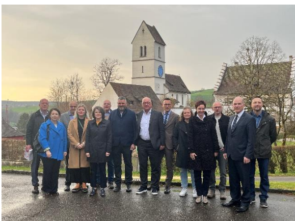
Der alljährliche Gemeindebesuch führte den Regierungsrat am 25. März nach Oltingen.