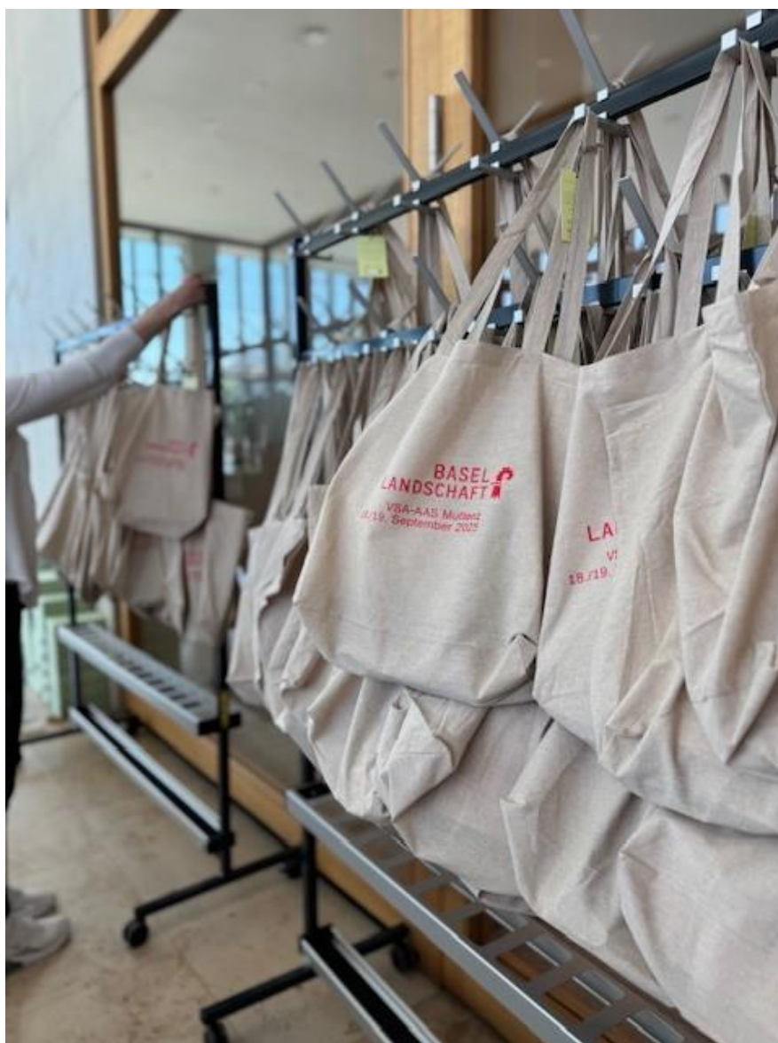
Mit dem nachhaltigen Give-Away soll der Kanton Basel-Landschaft den Teilnehmenden des VSA-Anlasses im Gedächtnis bleiben (Foto © Staatsarchiv BL).

Der FHNW-Campus Muttenz punktete dabei nicht nur mit seiner aussergewöhnlichen Architektur, einem spektakulären Atrium und einer grosszügigen Aula; er erwies sich auch durch seine zentrale Lage, die technische Ausstattung und die Infrastruktur als perfekter Veranstaltungsort für den zweitägigen Grossanlass. Sowohl die Jahresversammlung als auch die Fachtagung verzeichneten mit jeweils knapp 200 Teilnehmenden einen Besucherrekord. Die Fachtagung widmete sich dem Thema «Archive als Dritter Ort? Ideen, Erfahrungen und Perspektiven». Referentinnen und Referenten aus unterschiedlichen GLAM-Institutionen, Sprachregionen und Ländern diskutierten, wie Archive sich weiter dem Publikum öffnen und zu «Dritten Orten» werden können – und was sie dadurch gewinnen. Abgerundet wurde der Anlass durch ein attraktives Kulturprogramm, das Führungen bei verschiedenen Baselbieter Institutionen wie dem Haus der Elektronischen Künste, der Hanro-Sammlung oder im Freidorf Muttenz vorsah. Der Anlass kann als voller Erfolg bezeichnet werden. Die Rückmeldungen der Teilnehmenden fielen durchwegs positiv aus, wobei neben der Organisation durch das Staatsarchiv vor allem der Veranstaltungsort sowie das Rahmenprogramm lobend erwähnt wurden.