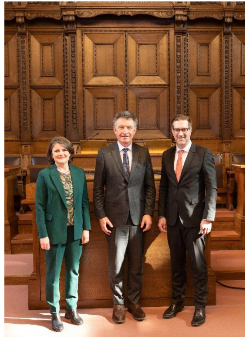
Regierungsrätin des Kantons Basel-Land, Kathrin Schweizer, Präsident der Région Grand Est, Franck Leroy, und Regierungspräsident des Kantons Basel-Stadt, Conradin Cramer (v.l.n.r.) anlässlich des offiziellen Besuchs in der Region.

Weitere wertvolle Begegnungen wurden in beiden Basel anlässlich des offiziellen Besuchs des Präsidenten der Région Grand Est Franck Leroy gemacht. Gegenstand des Treffens bildeten Fragen der grenzüberschreitenden Zusammenarbeit mit einem speziellen Fokus auf die Themen Innovation, Beziehungen Schweiz–EU und Verkehr. Die beiden Kantone und die Région Grand Est betonten dabei ihre engen wirtschaftlichen, kulturellen und freundschaftlichen Beziehungen. Nach dem Arbeitsgespräch besichtigten die Delegationen den Switzerland Innovation Park Basel Area in Allschwil. Der Austausch fand einen Abschluss mit der Besichtigung des Baus HORTUS – House of Research, Technology, Utopia and Sustainability.