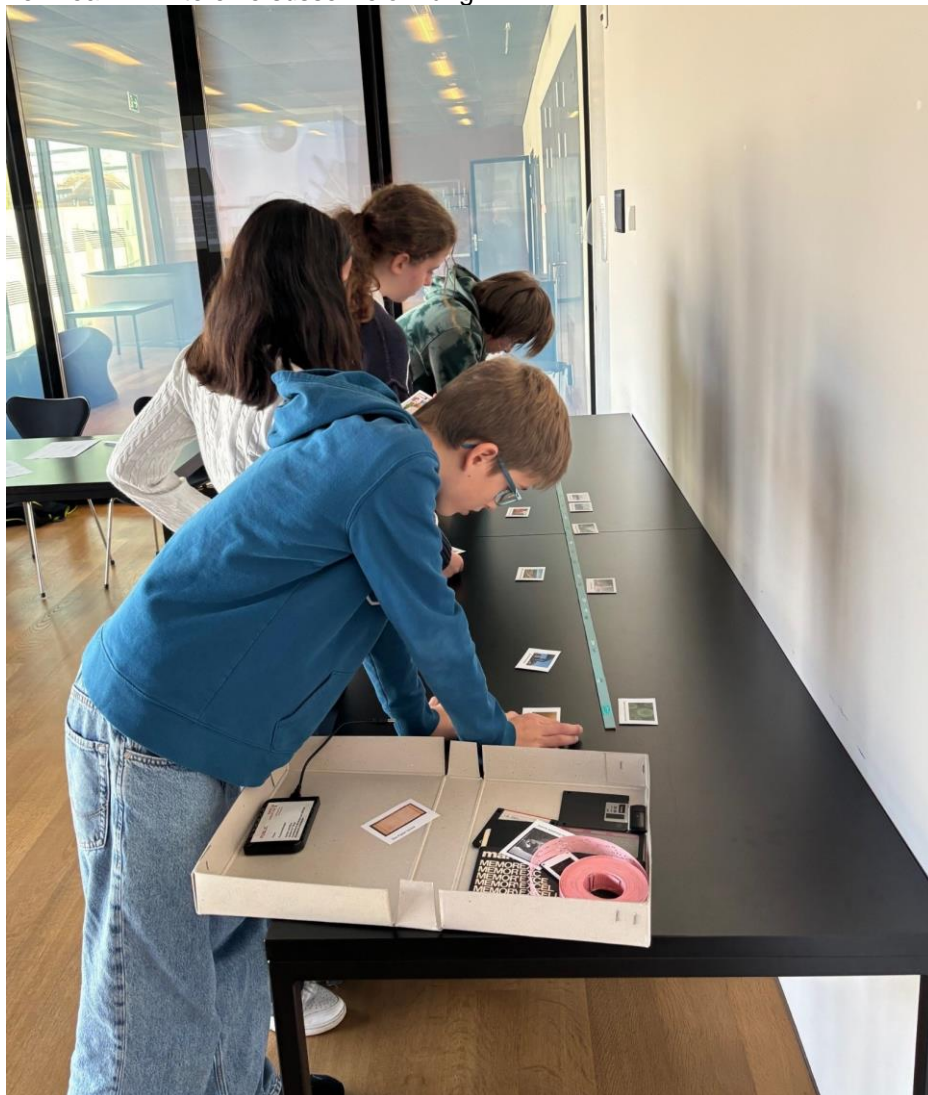
Gar nicht so einfach: Die Jugendlichen versuchten, verschiedene Datenträger und historische Ereignisse in eine chronologische Reihenfolge zu bringen.

Kenntnisse, indem sie prägende Ereignisse der Kantons- und Weltgeschichte, wie das Münchensteiner Eisenbahnunglück oder den Ausbruch des Ersten Weltkriegs, auf einem Zeitstrahl einordneten. Dem Gewinner-Team winkte eine süsse Belohnung.