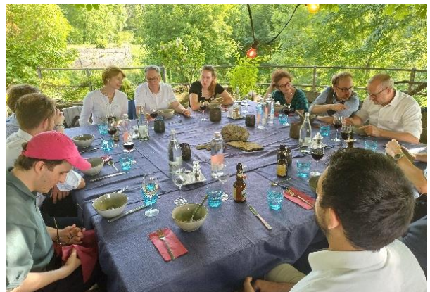
Nachtessen der Geschäftsleitung des Landrats mit den Ratsbüros aus Basel-Stadt und dem Jura nach einer gemeinsamen Sitzung am 12. Juni 2025 im Seminarhotel Wasserfallen.