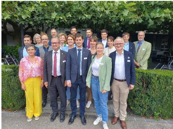
Die Geschäftsleitung des Landrats mit dem Büro des Solothurner Kantonsrats nach dem gemeinsamen Mittagessen im Bad Bubendorf am 11. September 2025.