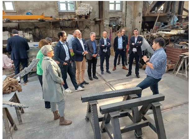
Beim Besuch im Kanton Aargau am 21. Oktober 2025 besichtigte die Geschäftsleitung des Landrats nebst der Grossratsitzung auch die Glockengiesserei Rüetschi AG, das älteste produzierende Unternehmen der Schweiz (gegründet 1367).