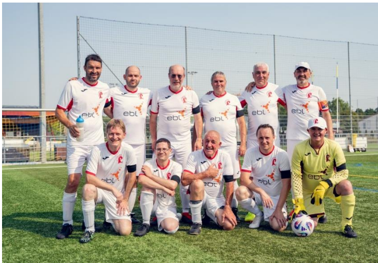
Oben: Der FC Landrat konnte am diesjährigen Eidg. Parlamentarier/innen-Fussballturnier nicht an den Vorjahreserfolg (Bronze in Baden) anschliessen. Am Turnier im genferischen Plan-les-Ouates resultierte ein 14. Rang. – Rechts: Konzentrierte Mitglieder des Baselbieter Landrats und des baselstädtischen Grossen Rats spielen am Jassturnier im Basler Rathauskeller um die Ehre – und um einen Preis vom Gabentisch.

Recht erfolgreich mit den Plätzen 2, 4 und 6 war die Baselbieter Delegation am gemeinsamen Jassturnier von Grossrat BS und Landrat BL, das am 12. November 2025 im Rathaus in Basel stattfand.