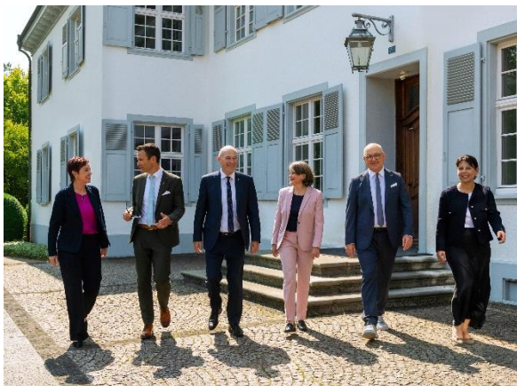
Offizielles Regierungsfoto 2025 vor dem Gebäude des Personalamts an der Rheinstrasse 24, Liestal. V.l.n.r.: Monica Gschwind, Thommy Jourdan, Anton Lauber, Kathrin Schweizer, Elisabeth Heer Dietrich.

Im Berichtsjahr hat der Regierungsrat an 37 ordentlichen Sitzungen (2024: 37) und 14 Klausuren (2024: 14) insgesamt 1'922 Geschäfte behandelt (2024: 1'856), 357 Landratsvorlagen überwiesen (2024: 323) und über 271 Beschwerden entschieden (2024: 241). Ausserhalb der regulären Sitzungen wurden 12 Zirkulationsbeschlüsse gefasst (2024: 12).