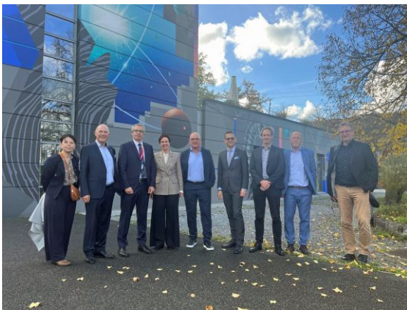
Der Regierungsrat besuchte am 21. Oktober das Paul-Scherrer-Institut in Villigen. Dieses ist mit 2'300 Mitarbeitenden das grösste Forschungsinstitut für Natur- und Ingenieurwissenschaften in der Schweiz.