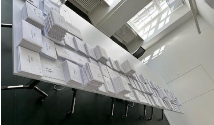
Initiativen Wirtschaftskammer Juli 2025.

Das Einreichen von Initiativen wurde in diesem Jahr rege genutzt. Dies generierte einen erheblichen Mehraufwand. Alle Unterschriftenbögen mussten sortiert und die Unterschriften in Zusammenarbeit mit den Gemeinden kontrolliert werden.