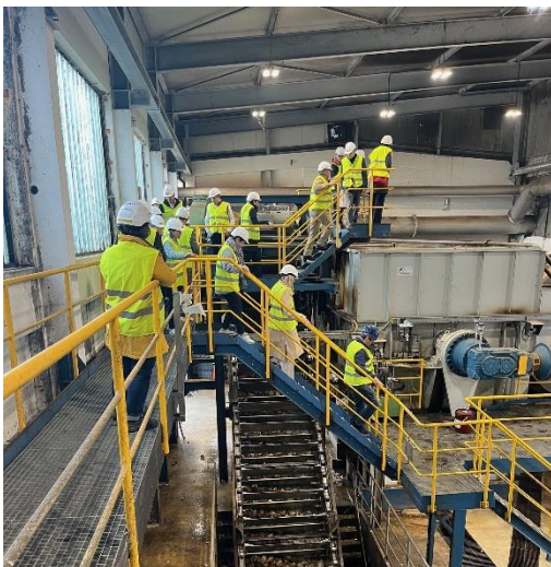
Am 23. Oktober besuchte der Regierungsrat die Regierung des Kantons Thurgau. Neben einer Besichtigung der Zuckerfabrik in Frauenfeld nutzen die beiden Regierungen das Treffen für einen breiten Austausch und zur Pflege der Freundschaft zwischen den beiden Kantonen.