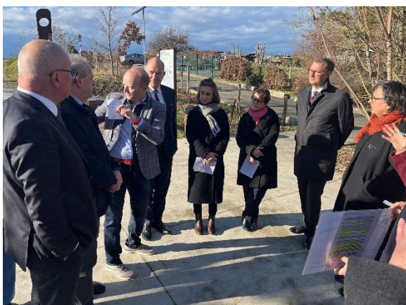
Anlässlich des Jahrestags des Elysée-Vertrags zwischen Deutschland und Frankreich besuchten Marion Paradas, französische Botschafterin in der Schweiz, und Michael Flügger, deutscher Botschafter in der Schweiz, den Kanton Basel-Landschaft. Nach einem Austausch mit dem Regierungsrat in Liestal besuchte die Delegation in Allschwil die Rue de Bâle, wo eine Grenzverschiebung zwischen der Schweiz und Frankreich nötig ist, um den Zubringer Allschwil für das Gebiet Bachgraben zu realisieren. Anschliessend besichtigte die Delegation das Swiss Tropical and Public Health Institute in Allschwil.

Im Berichtsjahr hat der Regierungsrat an 37 ordentlichen Sitzungen (2024: 37) und 14 Klausuren (2024: 14) insgesamt 1'922 Geschäfte behandelt (2024: 1'856), 357 Landratsvorlagen überwiesen (2024: 323) und über 271 Beschwerden entschieden (2024: 241). Ausserhalb der regulären Sitzungen wurden 12 Zirkulationsbeschlüsse gefasst (2024: 12).