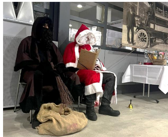
Grosse Überraschung war der Samichlaus, der zu Besuch kam und über jedes Team etwas zu berichten wusste.