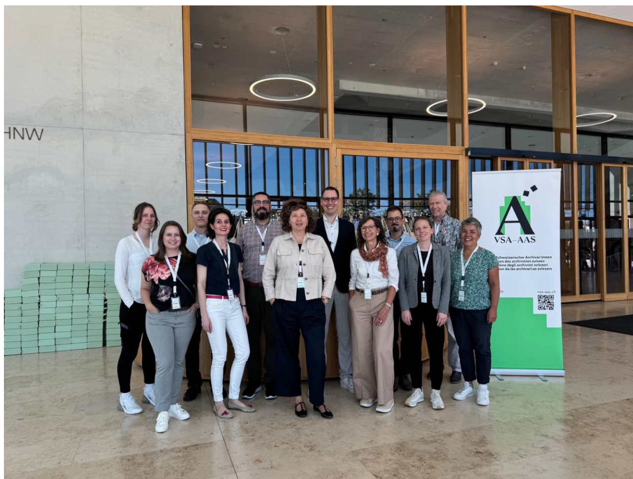
Das Team des Staatsarchivs war bestens auf die Jahresversammlung und Fachtagung des VSA vorbereitet

Mit dem Entscheid des Landrats im November wurden die grundlegenden Weichen gestellt für den dringend benötigten Ausbau von Magazinressourcen für die Papierarchivierung. Höhepunkt des Jahres war die Organisation und Durchführung der Jahresversammlung und Fachtagung des Vereins Schweizerischer Archivarinnen und Archivare (VSA), welche im September an der FHNW Muttenz stattfanden und einen Besucherrekord aufwiesen. Letztmals war der VSA 1992 zu Gast im Kanton Basel-Landschaft. Mit der Integration von 21'000 Artikeln des Nachrichtenportals OnlineReports in den digitalen Lesesaal konnte das Angebot mit Informationen aus den letzten 30 Jahren angereichert werden. Zu den Highlights zählen auch die verschiedenen Veranstaltungen wie beispielsweise die Podiumsdiskussion im Rahmen der VHS-Veranstaltung «Helene Bossert und der Kalte Krieg in der Schweiz» wie auch der Tournee-Start des Programms «Sage uf d Ohre – Baselbieter Sagen unterwägs», welche beide auf ein grosses Interesse beim Publikum stiessen.