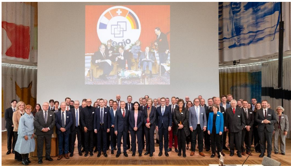
Gruppenfoto der der Vertreterinnen und Vertreter der D-F-CH Regierungskonferenz anlässlich deren 50 Jahre Jubiläum in den Räumlichkeiten der Roche (wo sie 50 Jahre zuvor entstand).

Ebenfalls im Zeichen der Zusammenarbeit stand der 2. Pandemiekongress der ORK am 28. November in Liestal. Rund 80 Teilnehmende, darunter Akteure der grenzüberschreitenden Gesundheitszusammenarbeit, Vertretungen von Gesundheitsbehörden sowie Expertinnen und Experten aus den Bereichen öffentliche Gesundheit und Krisenmanagement, diskutierten die Kooperationsmöglichkeiten im Falle einer erneuten Gesundheitskrise. Im Fokus des Kongresses standen die Weiterentwicklung der während früherer Pandemien gewonnenen Erkenntnisse, die Umsetzung konkreter Massnahmen sowie die Setzung neuer politischer Impulse zur Stärkung der grenzüberschreitenden Zusammenarbeit im Gesundheitsbereich.