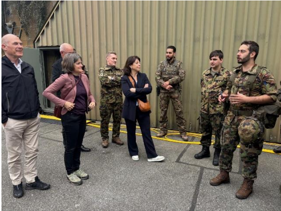
Am 15. Oktober besuchte der Regierungsrat Der Regierungsrat das Stabsbataillon der FU Br 41 an zwei Standorten im Raum Luzern.