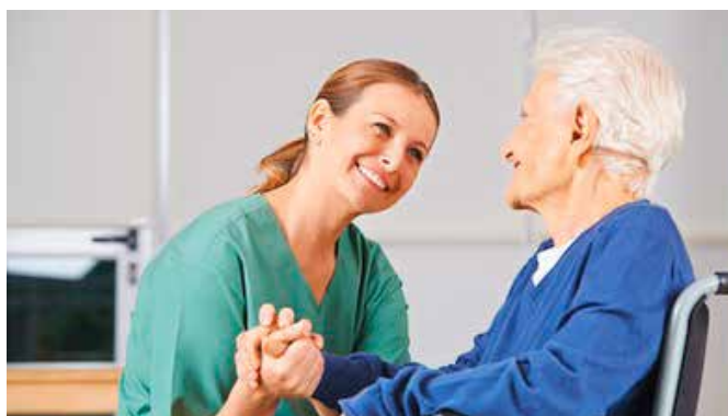
« TRISAN » soll das Angebot in Bereichen wie Pflege, Rettungsdienst und Patientenmobilität verbessern

« TRISAN », ein trinationales Kompetenzzentrum im Gesundheitsbereich, wurde 2016 lanciert, um das Versorgungsangebot am Oberrhein zu verbessern (BL: 30'000 Franken, total: ca. 800'000 Euro). Dank der Vernetzung von Gesundheitsakteuren erfolgte ein Austausch von Best-Practices und Wissen über das deutsche und französische Gesundheitssystem sowie die Zuständigkeiten der Akteure, was die Zusammenarbeit in der Grenzregion erleichtert. Weiterer Pluspunkt: Trinationale Informationsanlässe zu Aus- und Weiterbildungen in Gesundheitsberufen können helfen, den Fachkräftemangel einzudämmen. Mit der Verstetigung von « TRISAN » im Jahr 2023 schreitet die Gesundheitskooperation am Oberrhein weiter voran ( Webseite ).