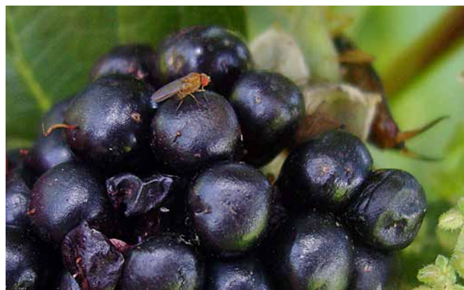
Die Kirschessigfliege bedroht nicht nur die Kirschernte im Baselland

Der Oberrhein ist eine attraktive Wirtschaftsregion. Damit dies so bleibt, unterstützte « Upper Rhine 4.0 », ein grenzübergreifendes Netzwerk aus Unternehmen, Dienstleistern und Hochschulen, KMU bei der digitalen Transformation (BL: ca. 77'800 Franken, total: ca. 4,55 Millionen Euro). Davon profitiert auch der Kanton BL als erfolgreicher und innovativer Wirtschaftsstandort. Schweizer KMU konnten vom trinationalen Wissens- und Technologietransfer profitieren, Partnerschaften eingehen und ihre Innovations- und Entwicklungspotenziale im Bereich Digitalisierung ausbauen. Damit kann der Kanton seine Standortattraktivität in der Industrie 4.0 steigern.