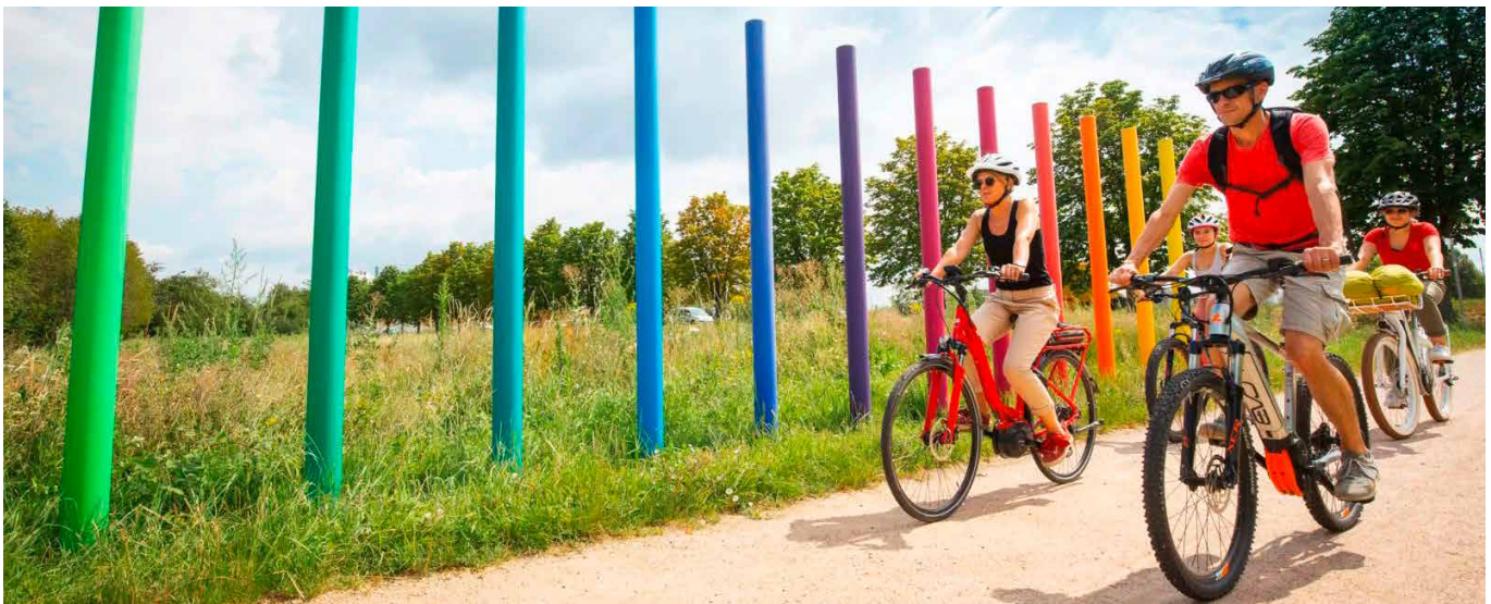
«Trois Pays à vélo» zielt darauf ab, die touristische Attraktivität des Oberrheins durch die Förderung des Radfahrens zu erhöhen